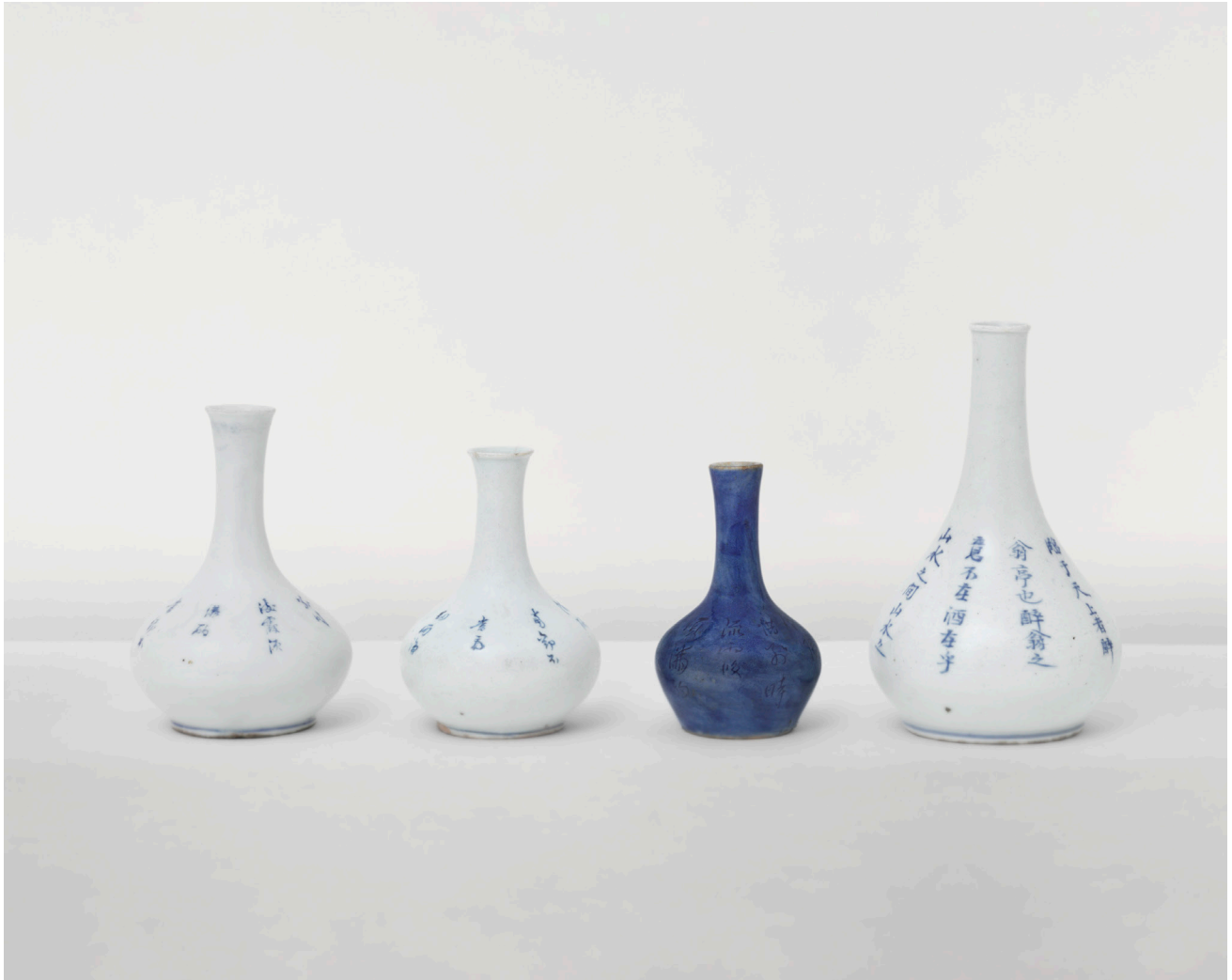
© Bohnchang Koo, EWB 02 , 2019. Piezas de porcelana cortesía de Ewha Womans University Museum, Seúl.

Bohnchang Koo (Seúl, 1953) vive y trabaja en Seúl, Corea. Su trabajo se ha expuesto individualmente en más de cuarenta ocasiones y forma parte de numerosas colecciones públicas entre las que destacan el Asian Art Museum en San Francisco; el Museum of Fine Arts, Houston; el Museum of Modern Art, San Francisco; y el National Museum of Modern and Contemporary Art en Seúl. Koo fue director artístico de la Daegu Photo Biennale 2008 en Corea del Sur, uno de los comisarios que colaboraron con Photoquai Paris en 2013, y nominador del Discovery Award 2014 en Recontres d'Arles. En la actualidad imparte clases en la Kyungil University en Corea.