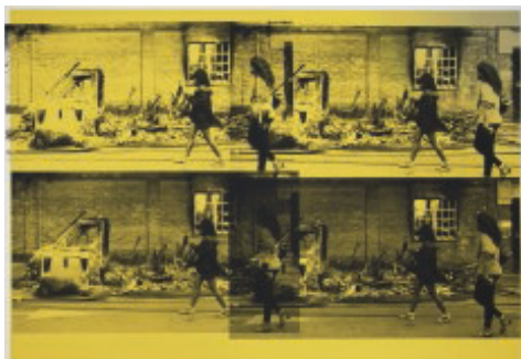
Una de las serigrafías de Gavin Turk