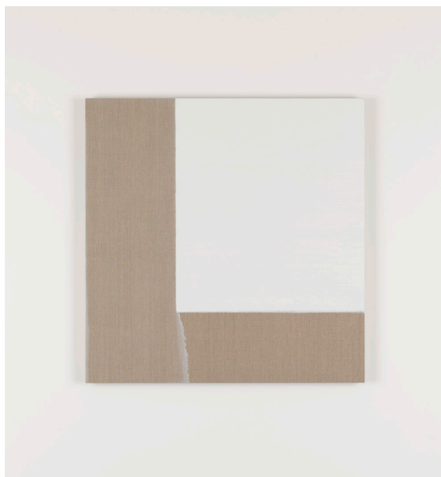
Exposed Painting Titanium White © Callum Innes

Inauguración, con presencia del artista: 14 de septiembre de 2017 19:30–21:00 h