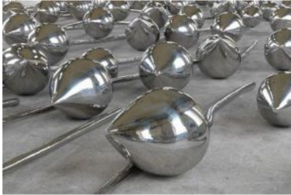
Una obra en Ivorypress

“Mao era poeta”, dice, no sin ironía. Let One Hundred Flowers fue el eslogan creado por él para una de sus campañas de propaganda revolucionarias en 1956. Sin embargo, la pieza pretende ir más allá de la referencia política y su contexto. Cien flores de loto cerradas, individuales y reunidas en una enorme masa no aluden sólo a una circunstancia histórica y política determinada, su carga metafórica es global e invita a pensar en el mundo actual con todas sus contradicciones.