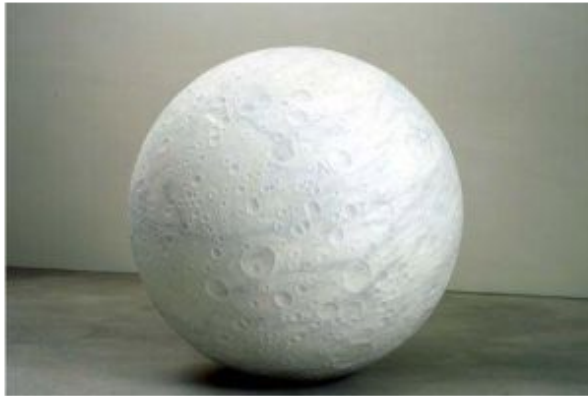
Una de las obras de Not Vital

Los cinco españoles que dan título a la primera obra son Velázquez –“sin duda el mejor pintor de todos los tiempos”, asegura -, Goya, Dalí, Buñuel y Pablo Picasso. Sus peculiares “retratos” de estos artistas fueron fabricados como una especie de pedestales forjados en plata y con dimensiones directamente relacionadas con su fecha de nacimiento, explica Vital con un metro en la mano. “Velázquez, 1599, ves...”, dice y mide la altura del rectángulo que lo representa, demostrándose a sí