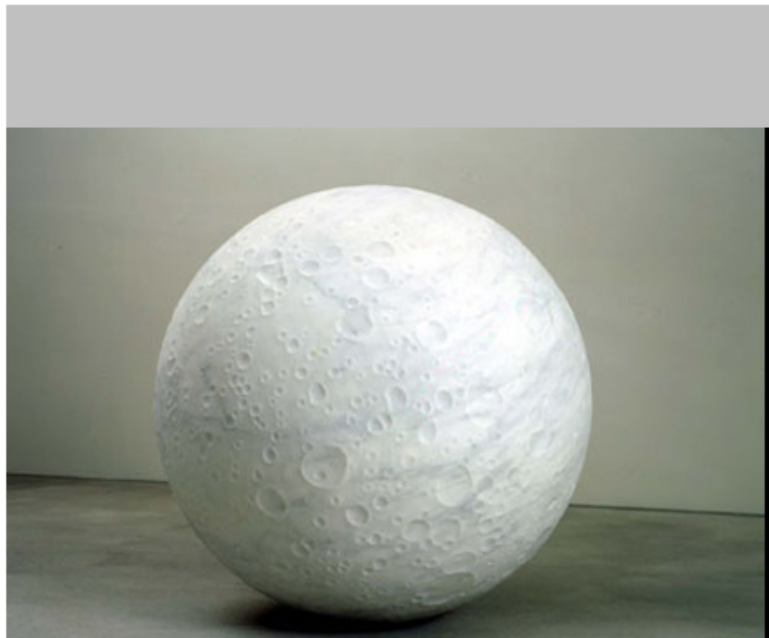
Moon, 2004. © Roland Reiter

Ivorypress: Not Vital expone '5 Spaniards & Nothing' en Madrid