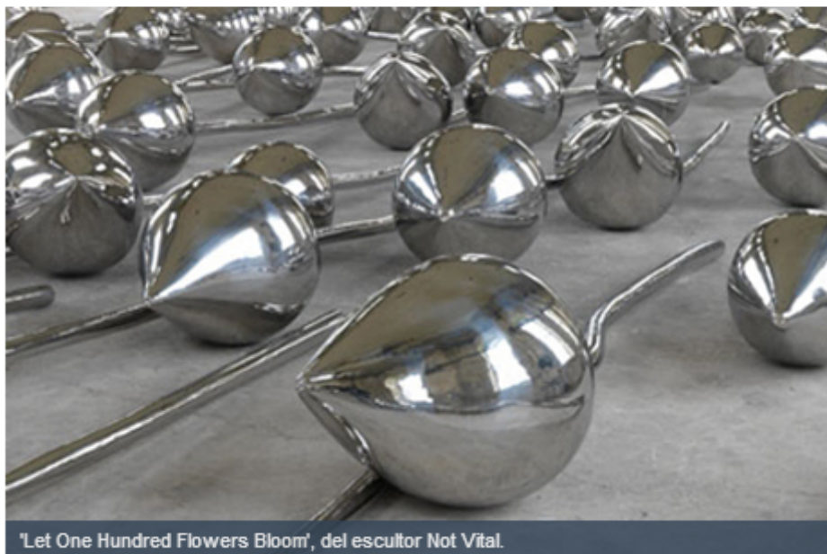
'Let One Hundred Flowers Bloom', del escultor Not Vital.