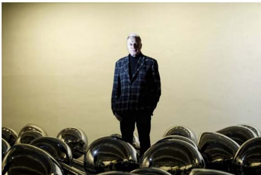
Not Vital, artista suizo fotografiado frente a uno de los montajes que expone en la galería Ivorypress de Madrid

Los materiales con que trabaja el artista suizo Not Vital son tan importantes y simbólicos como el concepto mismo que hay detrás de sus instalaciones y esculturas: bloques de carbón extraídos de las profundidades de una mina de Mongolia, transformados después en evocaciones de las montañas de los Alpes de su infancia; piezas de mármol de Carrara de cuatro toneladas para modelar Moon , luna que te atrapa como un imán y parece levitar pese a su volumen; o plata purísima, trabajada a martillo en Níger con la ayuda de artesanos y técnicas Tuareg, a modo de homenaje a grandes artistas que trascendieron épocas y fronteras... La primera exposición de Not Vital en España, inaugurada el jueves en la galería Ivorypress de Madrid , tiene el nombre de 5 Spaniards&Nothing y puede disfrutarse como un viaje al centro de la tierra pero también al núcleo del corazón humano.