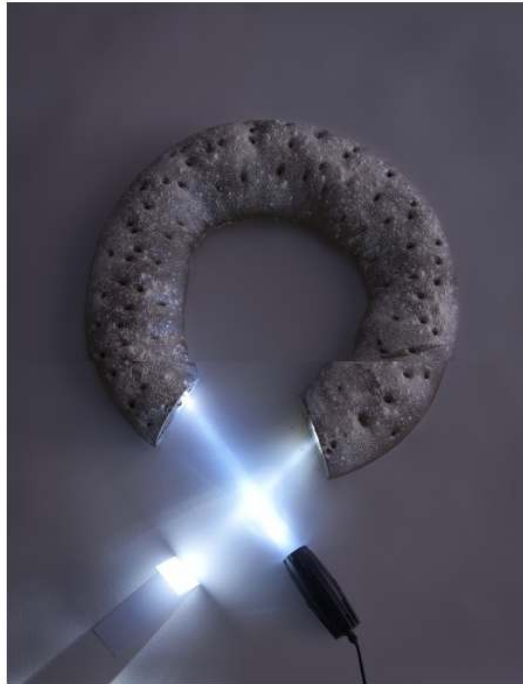
Los Carpinteros, Luz dentro de Pan, 2012, pan, espejos, madera, foco | Cortesía Ivorypress y Los Carpinteros

En series como Galletas , reproducciones en porcelana a tamaño real de conocidas variedades de este tipo de dulce, la marca comercial ha sido sustituida por una palabra escogida entre las más reiteradas en la prensa española durante 2013. Una instalación compuesta por una veintena de galletas asume el compromiso de simultanear su condición de objeto decorativo y apariencia real apetecible, con palabras que resumen la tensión del vocabulario periodístico español.