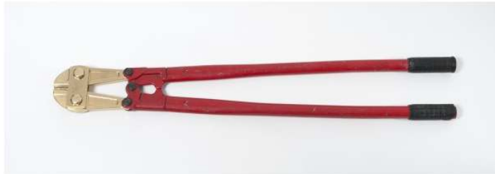
Los Carpinteros, Cizalla, 2012, hierro y oro