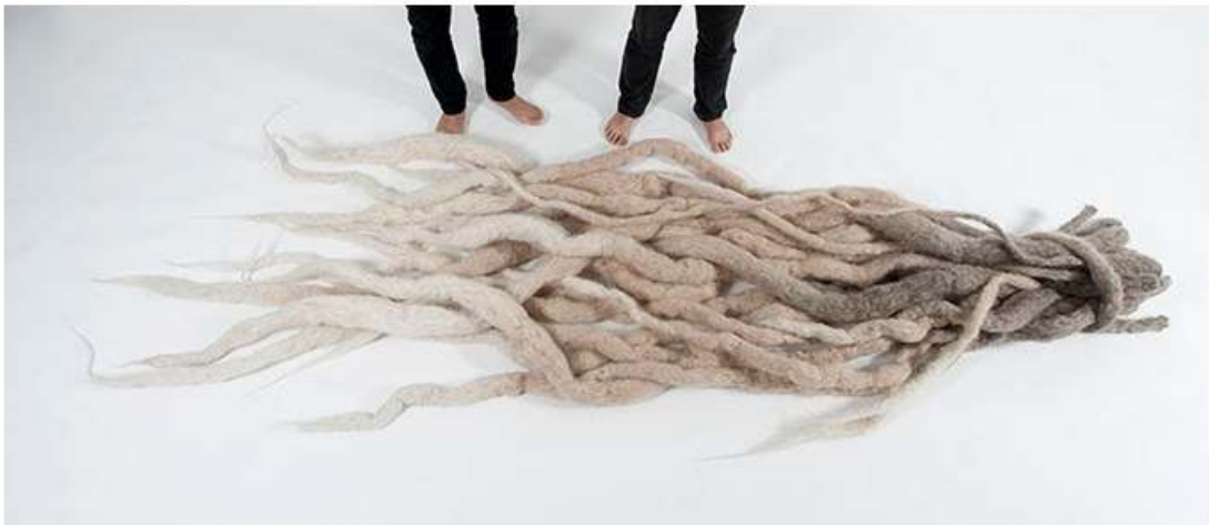
Los Carpinteros, El Gran Rasta , 2013 Cortesía de Ivorypress y Los Carpinteros

Esta noche en Madrid: Bazar de Los Carpinteros. El espacio de arte contemporáneo Ivorypress está organizando la segunda exposición de Los Carpinteros, que abrirá esta noche. Obras de formato pequeño y mediano representan la mayor parte de la serie, que se centra en tres de los vídeos recientes del dúo - incluidos Conga Irreversible (Irreversible Conga) , que muestra la actuación organizada por Los Carpinteros durante la 11na Bienal de La Habana. Le aconsejo ponerlo en su calendario: la muestra estará abierta solamente hasta el 5 de marzo.