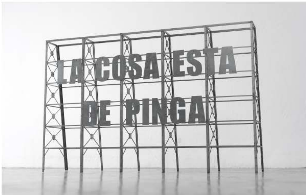
Los Carpinteros, La Cosa está de pinga, 2013, zinc galvanizado

Ivorypress presenta Bazar , la segunda exposición de Los Carpinteros en la galería madrileña. En esta ocasión se presentan una serie de piezas de pequeño y mediano formato, así como tres videos que denotan un cambio importante en la línea de trabajo de estos artistas cubanos. Preocupaciones en torno a la figura humana —ya sea de orden fisiológico, ideológico o de consumo— son expuestas desde una perspectiva antropológica, señalando procesos orgánicos y simbólicos en los que subyacen cuestiones de temporalidad, estética y banalización cultural y social.