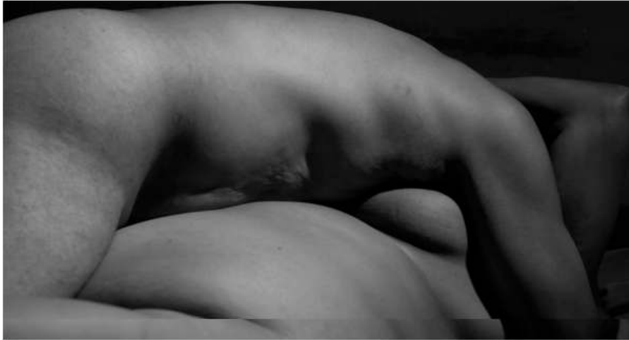
Los Carpinteros, still de video Pellejo, 2013, 11 min.

Otra de las piezas audiovisuales es Pellejo . Rodado en un escenario real, es una proyección en blanco y negro que muestra las transformaciones físicas que sufre el cuerpo humano en el tiempo a través de un solo acto sexual y en el que sucede un progresivo proceso de envejecimiento. Polaris , el tercero de los videos, describe la travesía de un músico con sus tambores a cuestras ascendiendo los Pirineos. También grabada en un escenario real es, esencialmente, una pieza sonora que explora grandes zonas de silencios, donde la noción de peregrinaje asume el protagonismo como ritual abstracto y personal.