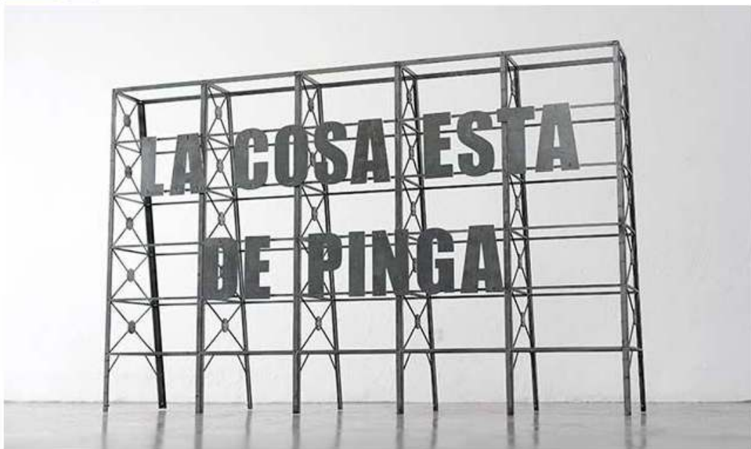
Los Carpinteros - La cosa está de pinga (2013) (Imagen por cortesía de Los Carpinteros e Ivorypress)

MADRID - Muchas son las distintas preocupaciones que, en torno a la figura humana, podemos encontrar. Sea desde orden anatómico, ideológico o bursátil, éstas son expuestas desde una expectativa antropológica, señalando procesos somáticos y alegóricos en los que subyacen cuestiones relacionadas con el tiempo, la estética y banalización cultural.