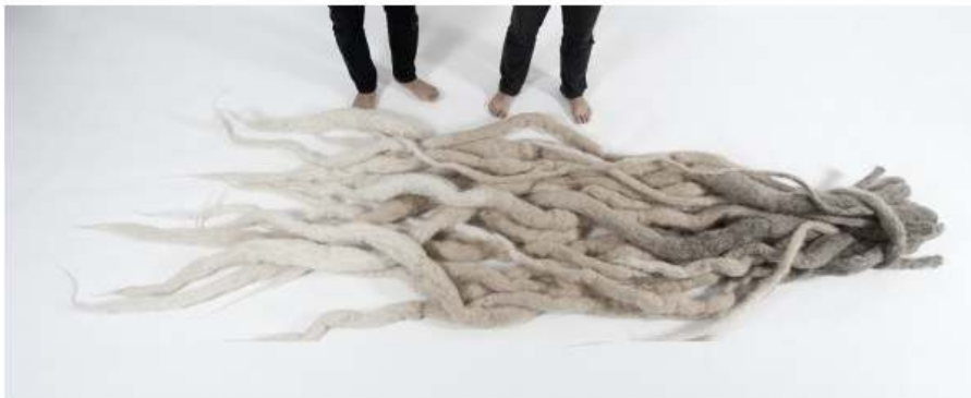
Los Carpinteros, El gran rasta, 2013, fibra sintética Kanekalon y alambre galvanizado

En este mismo contexto se sitúa El gran rasta , que asume un protagonismo distintivo en la muestra. La pieza refleja el paso de un centenar de años a través del pelo que nace de un color y se va decolorando, con lo que consigue advertir sobre un pasado y un presente de rebeldía y descontento cívico.