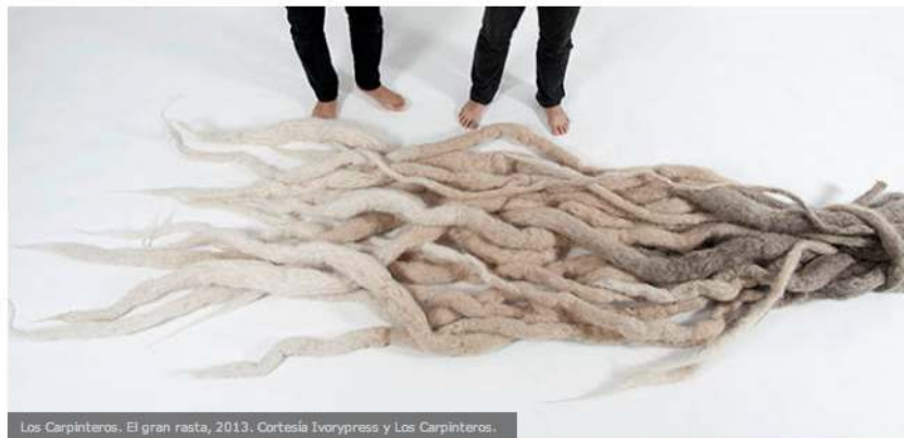
Los Carpinteros. El gran rasta, 2013. Cortesía Ivorypress y Los Carpinteros.