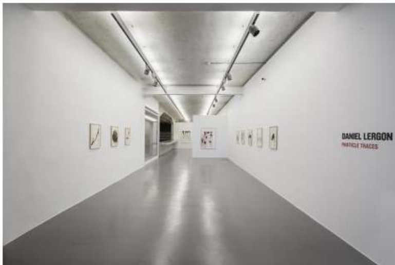
Daniel Lergon. Particle Traces

Aquella exhibición era su primera individual en nuestro país. A partir de hoy y hasta el 16 de enero, Daniel Lergon regresa a Ivorypress con una serie de obras sobre papel pintadas con diferentes metales en polvo en las que, en lugar de pinturas y pigmentos industriales, ha utilizado elementos metálicos puros para asociar masa y grano, aplicando al papel con pincel metales como el hierro, el cobre, el estaño o el zinc recubierto de vinilo.