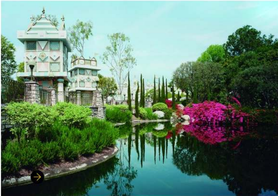
Thomas Struth Pond Anaheim, California, 2013