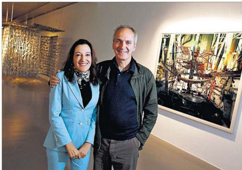
Cristina Iglesias y Thomas Struth, en la galería Ivorypress.

Thomas Struth propone una visita por algunos de sus últimos trabajos, que ya se pudieron ver en Berlín y Nueva York. No son sus fotografías más fáciles. Pi-