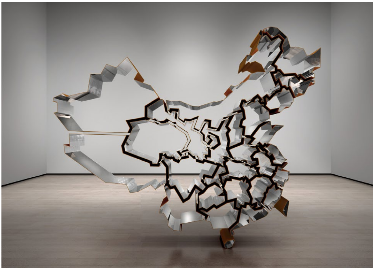
Free Standing China | Ron Arad, 2009

La muestra, que podrá visitarse hasta el 9 de noviembre, ofrece una panorámica de su singular visión de la arquitectura, el diseño y el objeto artístico. Desde su gran interés por la experimentación, Ron Arad estudia, a través de sus piezas, las posibilidades de expresión de distintos materiales como el acero, el aluminio, el Corian o el polietileno.