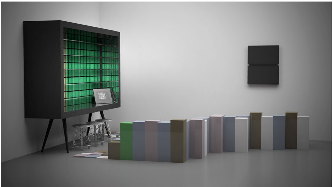
Estantería No Baz Colours | Ron Arad, 2013 | Cortesía de Ivorypress y del estudio del artista

Fecha y hora: 6 de septiembre de 2013 a las 12:00 h