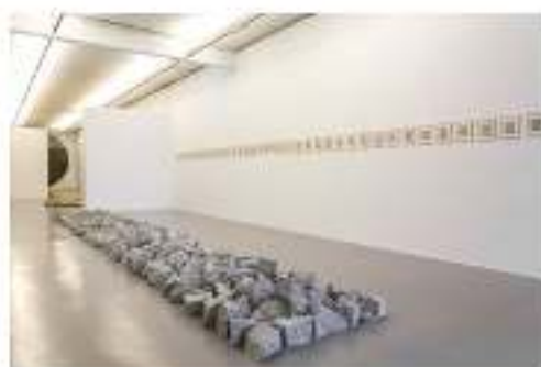
Las piedras son un elemento recurrente en la obra de Richard Long. /Marjorie Blanchet

Cuando camino, todo se vuelve más sencillo. Es un tipo de felicidad estúpidamente simple ”