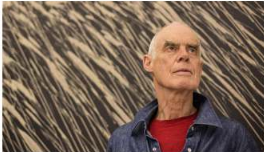
Richard Long.