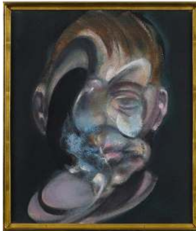
SELF-PORTRAIT (SELF-PORTRAIT) copy by FRANCIS BACON FROM THE ESTATE OF FRANCIS BACON. ALL RIGHTS RESERVED. DAVID VIGOR BLISS 2019

Retrospectiva sobre el pintor surrealista cubano Wifredo Lam que ya disfrutó de un considerable éxito en el Georges Pompidou el año pasado. Recordemos que el propio Reina Sofía le dedicó otra exposición en 1992, lo que dará ocasión a los más veteranos del lugar para la realización de interesantes análisis comparativos.