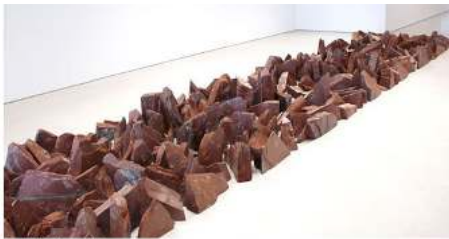
Red Slate Line, 2015