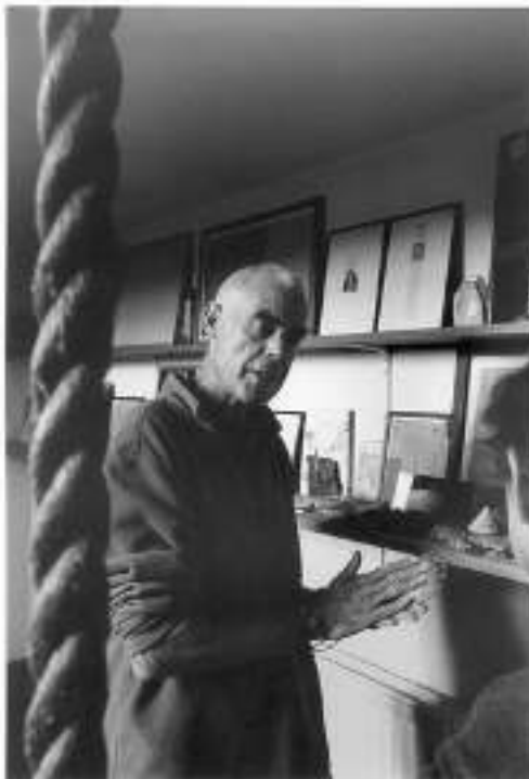
Richard Long durante su última visita a Ivorypress.

Su patio de recreo fueron el río y los acantilados que se encontraban próximos a su casa en Bristol (Inglaterra). Artista desde que era niño, según reconoce él mismo, a Richard Long (1945) le permitieron sus profesores del colegio que se saltara ciertas clases para poder pintar. Formado entre 1966 y 1968 en la Saint Martin's School of Art de Londres, Long es uno de los grandes exponentes del land art (que se crea en la naturaleza o con elementos provenientes de ella) y el único artista que ha estado nominado en cuatro ocasiones al Premio Turner , habiéndolo ganado 1989. Famoso por sus largas caminatas por diversas partes del mundo, las cuales inmortaliza a través de fotografías de la huella que deja (ya sea en forma de esculturas de piedras, o con sus propias pisadas), o trayendo elementos de ese paisaje a galerías y museos , o en sus curiosas obras de texto , ahora Ivorypress presenta Gravity del 23 de febrero al 2 de abril, dentro del marco de su 20 aniversario.