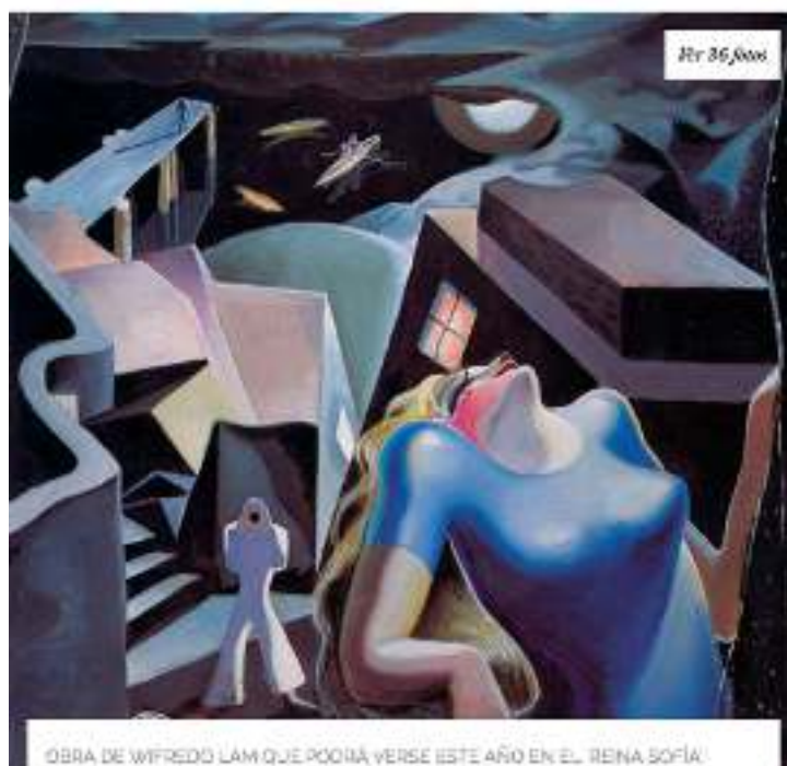
OBRA DE WIFREDO LAM QUE PODRÁ VERSE ESTE AÑO EN EL REINA SOFÍA.