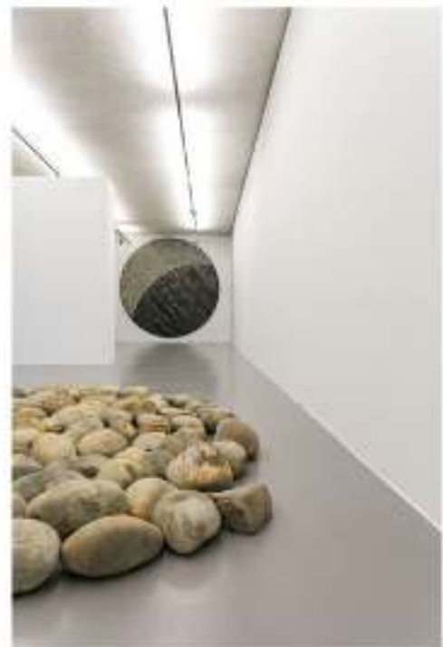
Una de las obras de la exposición 'Gravity', en Ivorypress (Madrid).

A los 71 años, Long es un hombre atlético y sorprendentemente alto, aunque hacerse una idea previa sobre su aspecto no es fácil: no le gustan los