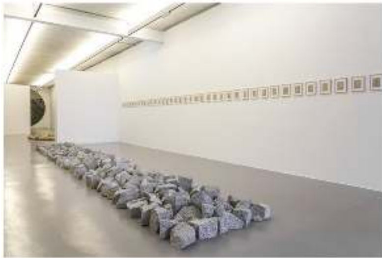
Dibujos de barro e instalaciones de Richard Long en Ivorypress