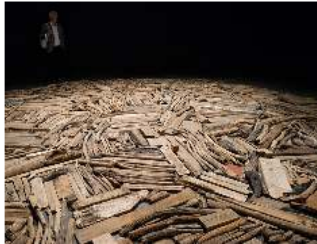
Instalación 'River Avon Driftwood' de Richard Long en Art Basel (Suiza) en junio de 2014.